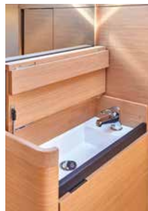
◀ Private sink (optional) Meuble vasque privatif (option) Privates Waschbecken (option) Mobiletto privato (opzionale) Mueble de aseo privado (opcional)