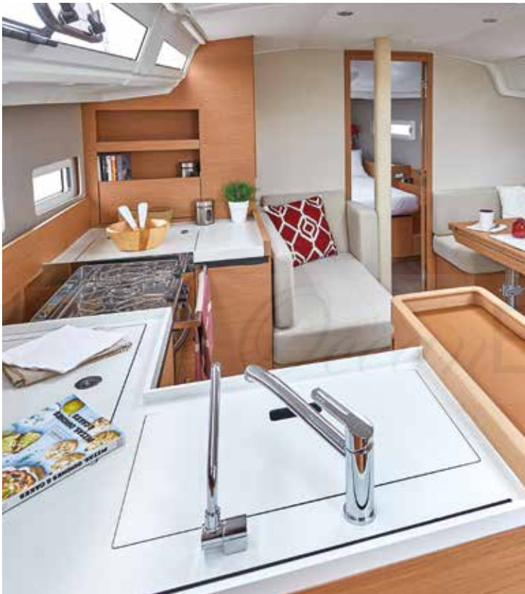
▲ A great central U-shape galley, very functional Une grande cuisine centrale en U, très fonctionnelle Eine grandiose Pantry in U-Form, sehr funktionell Una gran cocina central en forma de U, muy funcional Una grande cucina centrale a forma di U, molto funzionale