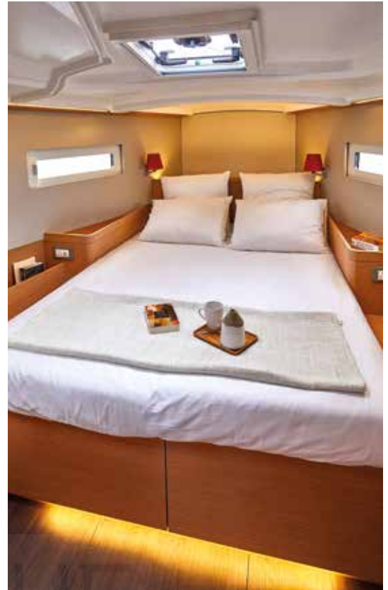
▲ High standard master cabin Cabine propriétaire de haut standing Eignerkabine mit hohem Standard Cabina propietario de alta gama Lussuosa cabina armatoriale