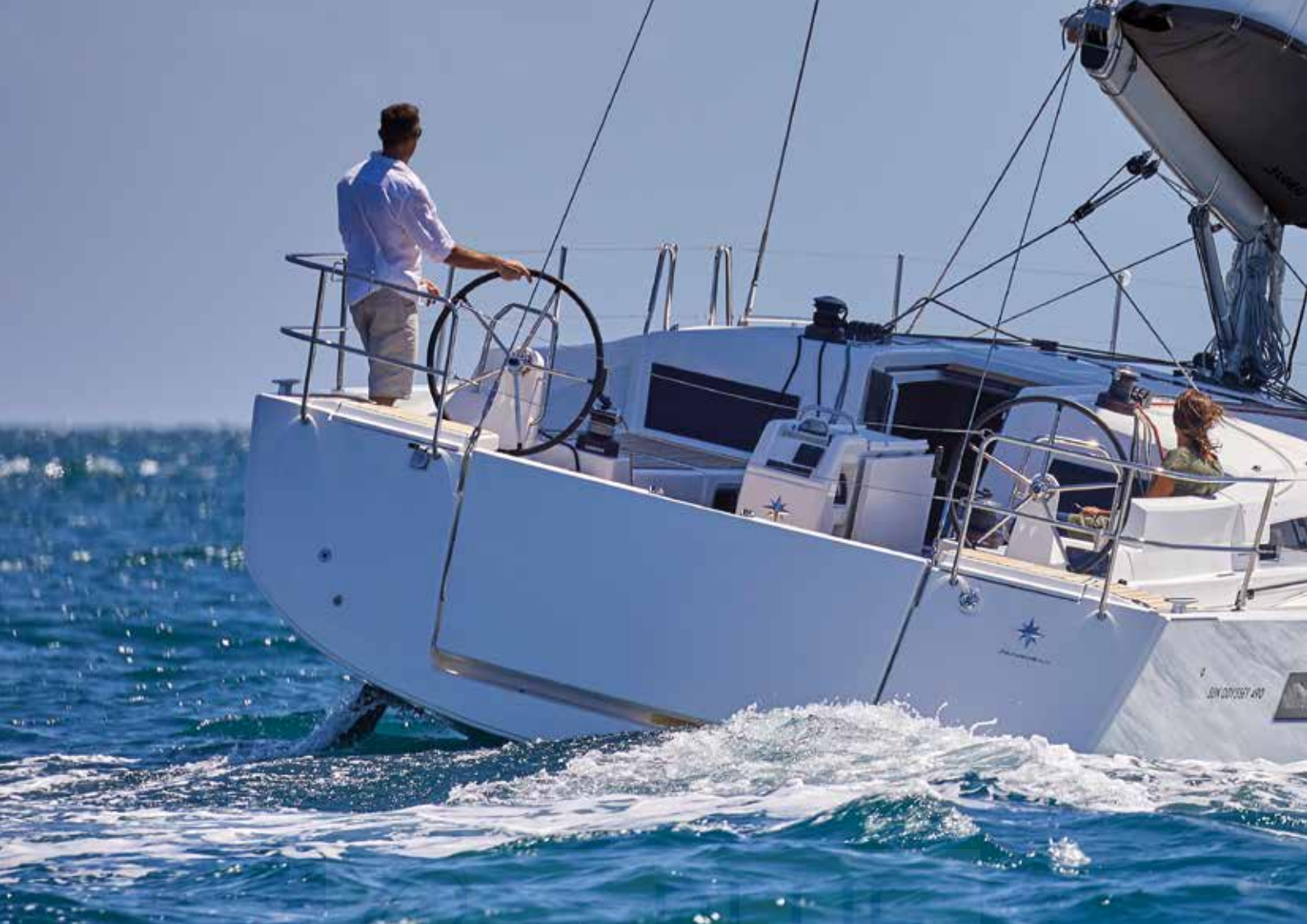
► Comfortable and functional cockpit Cockpit confortable et fonctionnel Komfortables und funktionelles Cockpit Carlinga confortevole e funzionale Cómodo y funcional pozzetto