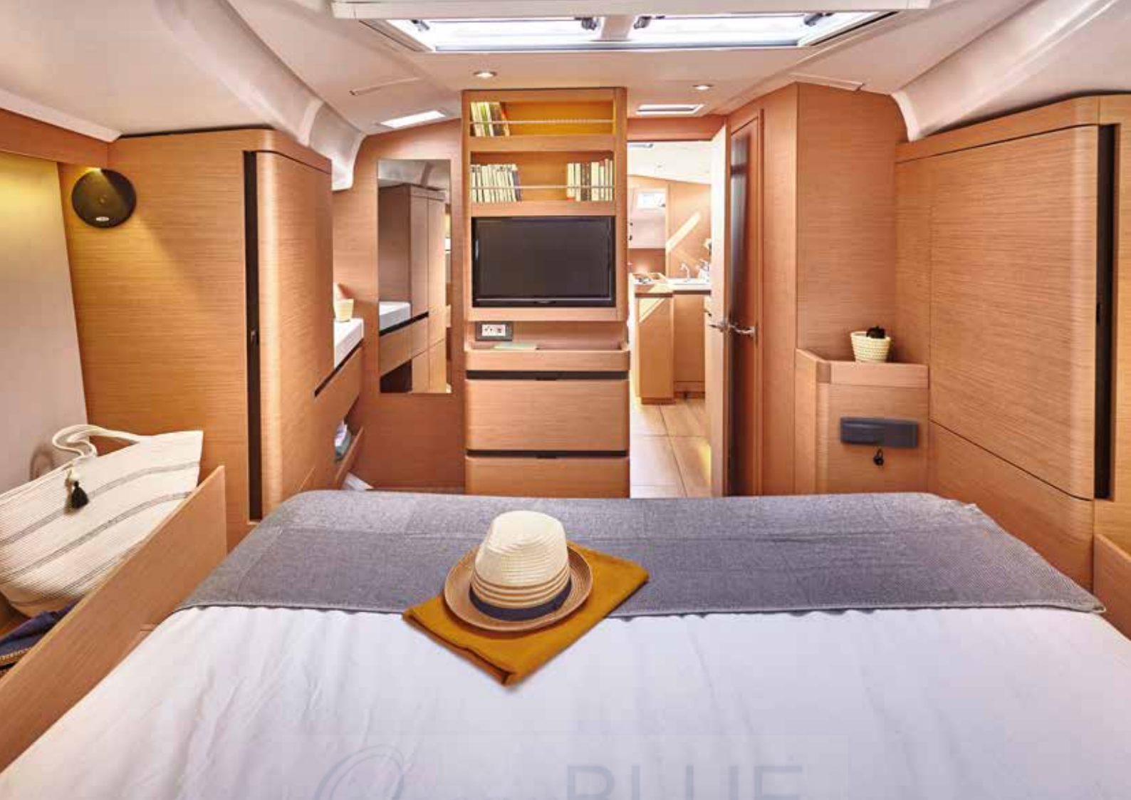
▲ Bright and voluminous master cabin Cabine propriétaire lumineuse et volumineuse Helle und großzügige Eignerkabine Cabina propietario luminosa y espaciosa Cabina armatoriale luminosa e con bei volumi