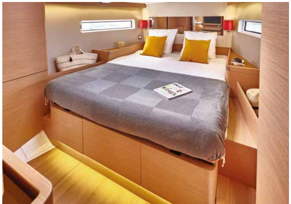
▲ High standard master cabin Cabine propriétaire de haut standing Eignerkabine mit hohem Standard Cabina propietario de alta gama Lussuosa cabina armatoriale