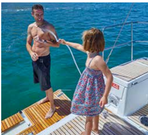
► Cockpit with a wide swim platform Cockpit avec large plateforme de bain Cockpit mit großer Badeplattform Cockpit con gran plataforma de baño Pozzetto con grande piattaforma di poppa