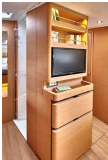
▲ Many spaces of storage and a private head Nombreux rangements et une salle de bain privative Viel verfügbarer Stauraum und ein Privates Waschräume Muchos espacio de almacenaje disponible y un privato baño Molteplici scomparti e armadietti e uno privato bagno